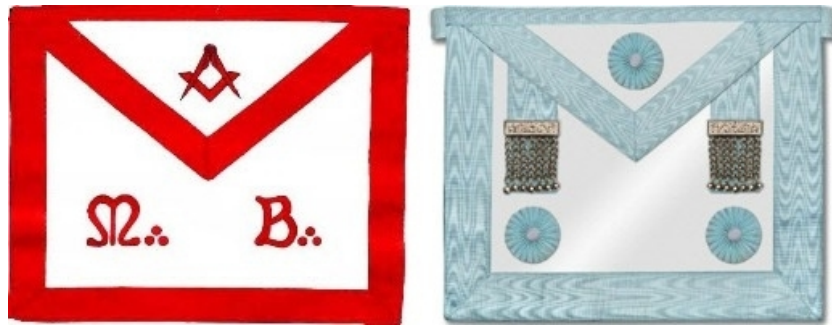
Slika 4. Crveno porubljena kecelja majstora Škotskog reda i plava kecelja majstora u Šrederovom ritualu.

Regularna velika loža Srbije koju je od 1993-e godne nakon priznanja Ujedinjenih velikih loža Nemačke, priznala i Ujedinjena velika loža Engleske, sastoji se od loža koje upražnjavaju uglavnom "Šrederov" ritual ("Schroeder rite"). Ovaj ritual je za domaće potrebe prekršten u "ritual R.V.L.S.", i pored njega se u manjoj meri upražnjava i obred emulacije. Praktikovanje Šrederovog rituala je direktno uslovljeno Nemačkim priznanjem jer je to najčešće upražnjavan ritual u Nemačkoj. Kecelje koje se nose u ložama gde se radi po Šrederu su sa plavim rubom, kao što je prikazano na slici 4.